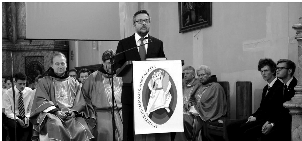
Hegyi László egyházi kapcsolatokért felelős helyettes államtitkár

85 éves az esztergomi ferences gimnázium