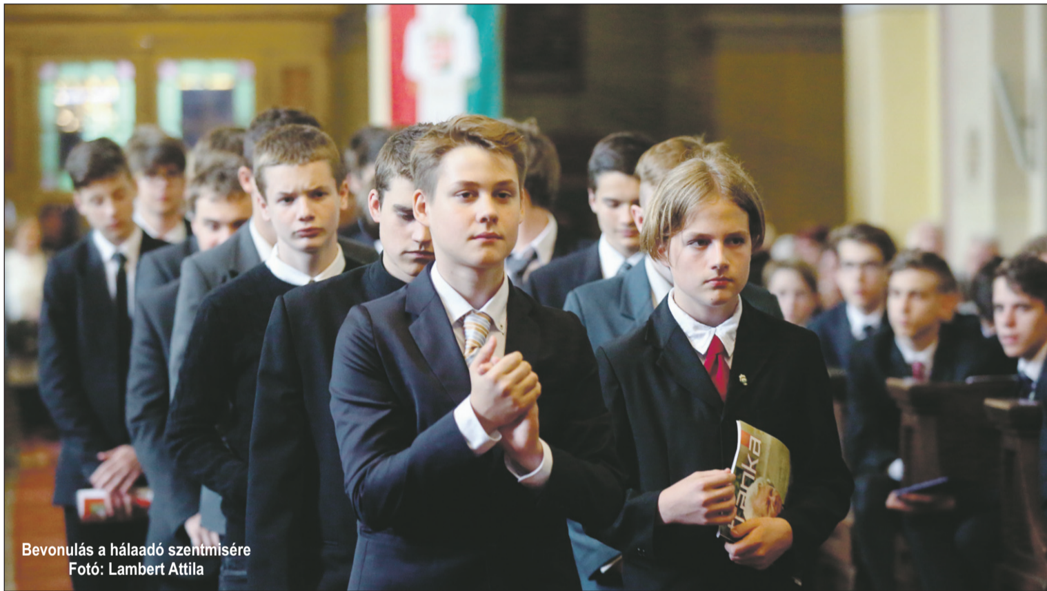
Bevonulás a hálaadó szentmisére