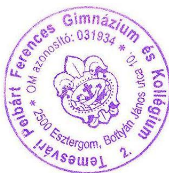
Szánthó Gellért igazgató